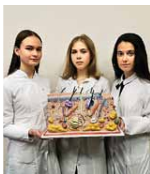
Проект «Врач будущего»