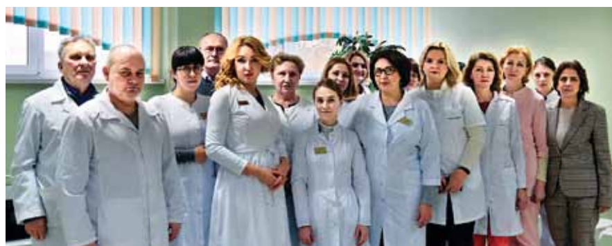
Сотрудники Брянского областного НВД

За 100 лет своей деятельности ГБУЗ «Брянский областной кожно-венерологический диспансер» постоянно развивался, обогащаясь новыми направлениями и медицинскими технологиями, расширяя сферу своей практической деятельности, приобретая и распространяя свой опыт, возвращая перспективных молодых специалистов, на которых областная медицина возлагает большие надежды в настоящем и будущем.