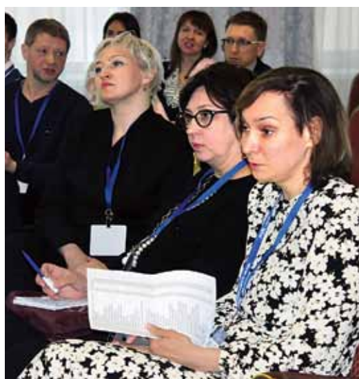
Участники круглого стола