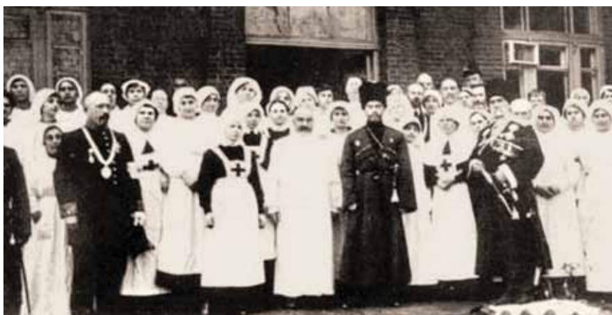
Император Николай II (в центре) с медперсоналом госпиталя