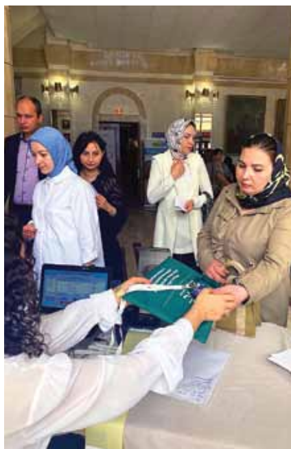
Регистрация участников конференции

Для дагестанской земли это стало знаковым событием, поскольку конференция такого уровня проходила здесь впервые. К тому же именно в 2022 году дерматовенерологическая служба Республики Дагестан отметила свое 95-летие. Мероприятие было органи-