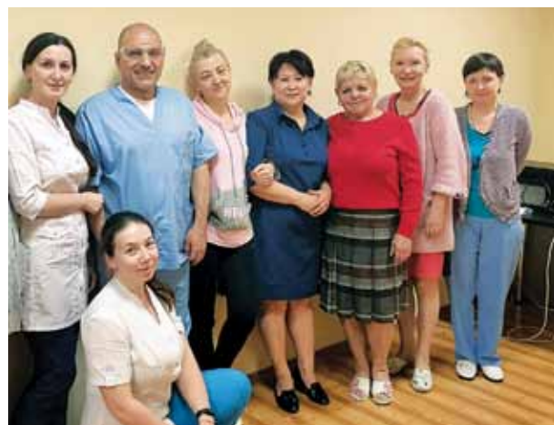
Сотрудники Клинического кожно-венерологического диспансера