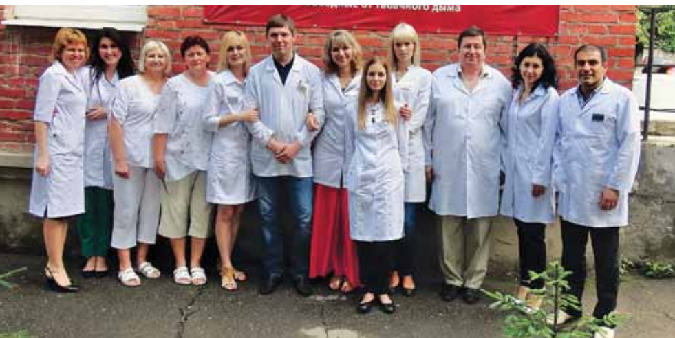
Сотрудники Клинического кожно-венерологического диспансера

В рамках Концепции развития здравоохранения Кубани осуществлена поэтапная реструктуризация и реорганизация службы, специализированная помощь максимально приближена к населению. С этой целью с 2011 по 2015 год в состав ККВД включены де-