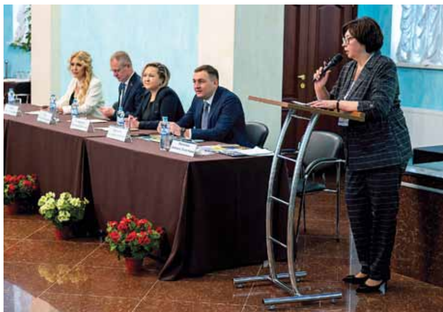
Открытие конференции. Приветственное слово

Современные проблемы требуют современных решений. Этот устоявшийся постулат остается актуальным для российских дерматовенерологов и косметологов. Все еще отдающийся эхом последствий и так заметный на медицинских статистических графиках пандемийный период отступил, и ему на смену пришел период адаптации, актуализации медицинских и организационных подходов. Где-то есть необходимость в изменении коечного фонда в соответствии с новыми требованиями, где-то не хватает молодых специалистов, а где-то просто организации и новых знаний. Этим и другим научно-практическим вопросам была посвяще-