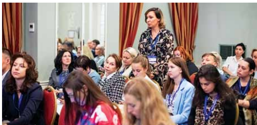
Участники круглого стола «Организационные вопросы ведения пациентов с базальноклеточным раком кожи в медицинских организациях дерматовенерологического профиля»