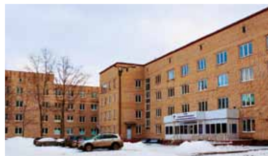
Здание Мордовского республиканского КВД

МРКВД — клиническая база курса кожных и венерических болезней МГУ им. Н.П. Огарева. В ординатуре по специальности «дерматовенерология»