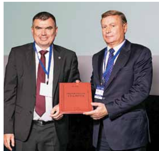
Награждение Почетной грамотой РОДВК коллектива Санкт-Петербургского ГБУЗ «Кожно-венерологический диспансер № 4»

Исполнительный комитет представил на утверждение делегатов новое положение о наградах РОДВК. Участники конференции единогласно утвердили предложенные изменения и приняли документ в новой редакции.