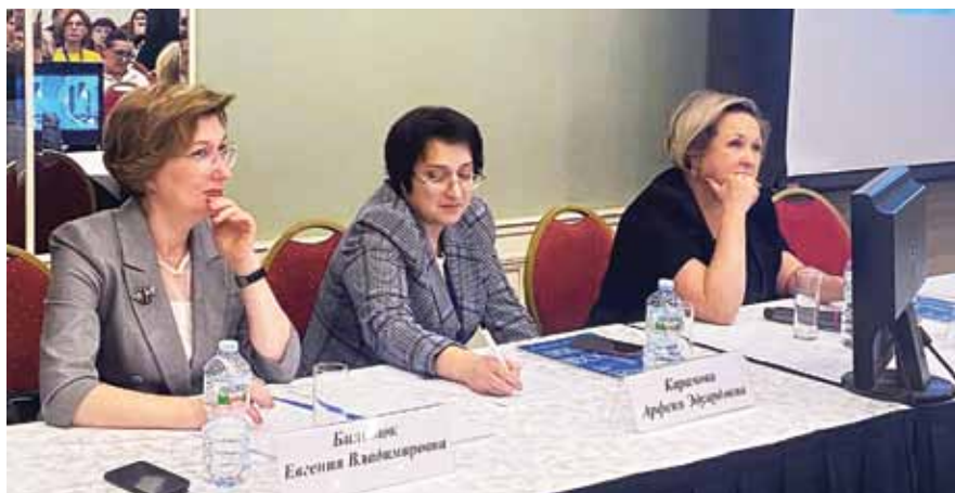
Модераторы круглого стола «Ведение регистра пациентов с хроническими заболеваниями кожи и подкожной клетчатки»

Регистр пациентов с хроническими заболеваниями кожи и подкожной клетчатки был создан в 2018 году в ГНЦДК. Это интернет-приложение, с помощью которого осуществляется сбор сведений о пациентах, страдающих тяжелыми, среднетяжелыми и ред-