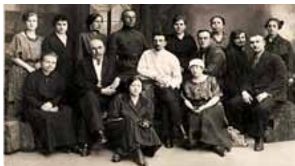
Сотрудники Тамбовского КВД