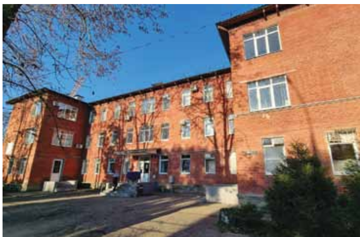
Здание Клинического кожно-венерологического диспансера

Клинический кожно-венерологический диспансер является ведущим лечебно-профилактическим учреждением Кубани и Южного федерального округа. Штат диспансера (145 врачей-дерматовенерологов и лаборантов и 156 средних медицинских работников) позволяет обслуживать большое число пациентов, до 377 тысяч посещений в год. На профильных койках диспансера получают лечение около 2500 больных в год, порядка 5000 пациентов лечатся амбулаторно. Благодаря современным диагностическим возможностям и высокому профессиональному уровню специалистов диспансер предоставляет медицинскую помощь в соответствии с требованиями клинических рекомендаций и стандартами оказания медицинской помощи Минздрава Российской Федерации.