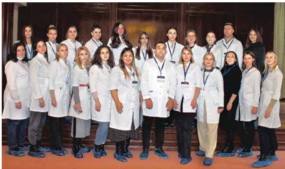
Участники Школы молодого специалиста

турные подразделения учреждения, узнали, как организована работа сотрудников его круглосуточного и дневного стационаров. Начинающие врачи ознакомились с отделением физиотерапии, которое на сегодняшний день является самым передовым в России по технической оснащенности. Физиотерапевты ГНЦДК продемонстрировали обширный набор методов фототерапии и аппаратных технологий, которые они используют в работе. Живой интерес у молодых дерматовенерологов вызвали научные исследования ученых отдела лабораторной диагностики ИППП и дерматозов. В настоящее время сотрудники ГНЦДК работают над семью научными темами, наиболее масштабной из которых является мониторинг резистентности возбудителей ИППП к антимикробным препаратам на территории Российской Федерации. В ходе экскурсии молодые врачи активно задавали вопросы, внимательно при-