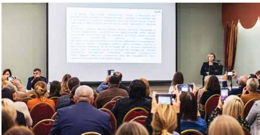
Круглый стол «Рост заболеваемости инфекциями, передаваемыми половым путем, в Российской Федерации — угроза биологической безопасности»

Добропорядочным частным структурам, которые не должны страдать