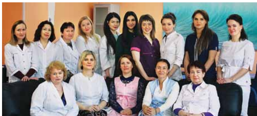
Сотрудники Мурманского областного центра специализированных видов медицинской помощи

Коллектив высококвалифицированных специалистов, высокотехнологичное оборудование, передовые медицинские методики и эффективные лечебные программы позволяют дерматовенерологической службе Мурманской области оказывать своим пациентам помощь, соответствующую мировым стандартам.