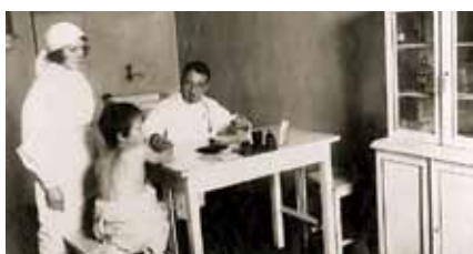
Первый в Тамбове вендиспансер